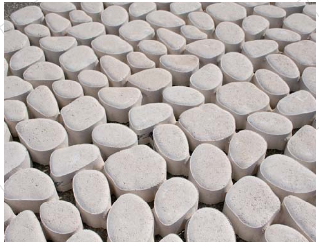
Dalle drainante engazonnée ou gravillonnée DURANCE

Fabemi propose également un large choix de pavés circulables aux propriétés techniques et esthétiques reconnues. Posés sur lit de sable afin de garantir le drainage des eaux de pluie sous l'ouvrage, le nouveau pavé martelé MAUBEC, le pavé brut LAVARDIN et le pavé vieilli au tonneau MÉDIÉVAL installent leur élégante singularité en terrasse, dans une cour ou tout autre lieu carrossable.