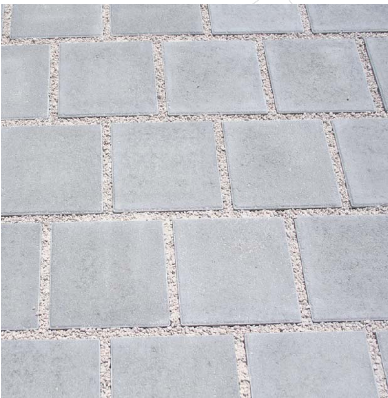
CARUS appareillé joints croisés - circulaire