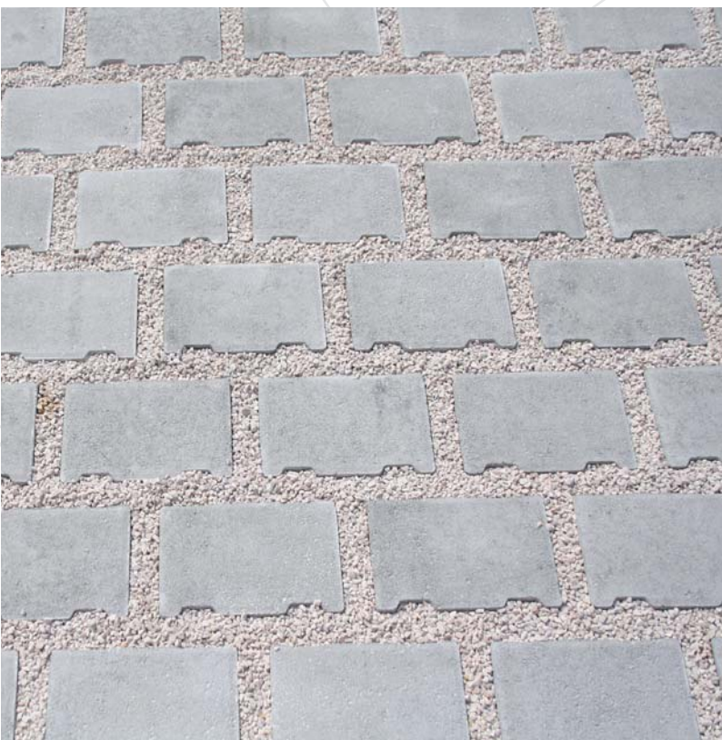
STRATUS appareillé joints croisés - circulaire